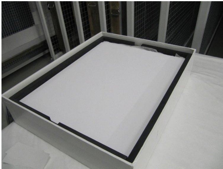
Caja interior realizada con materiales libres de ácido.