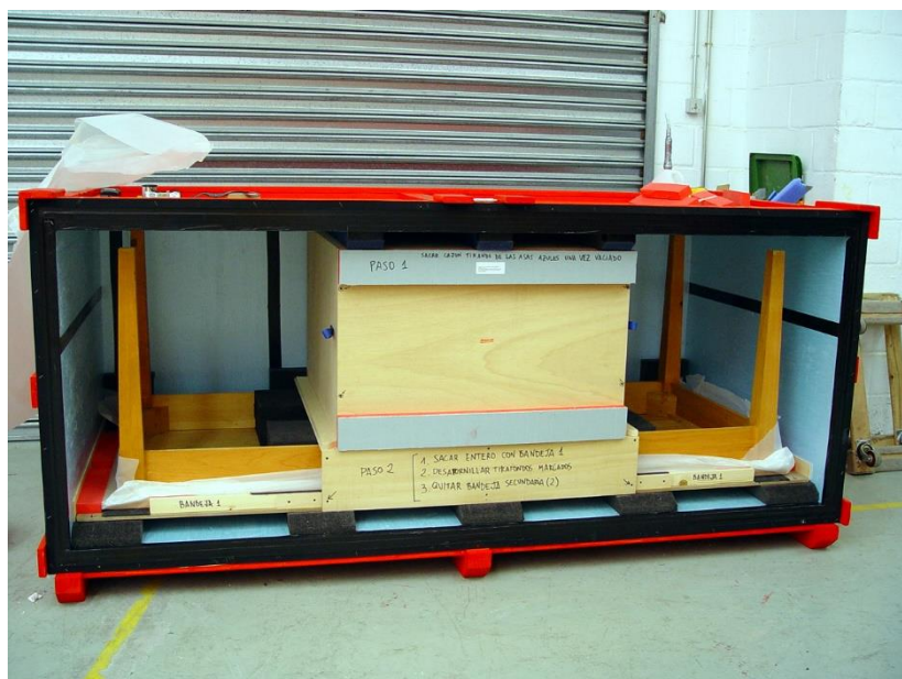
Caja compartida para obras tridimensionales.