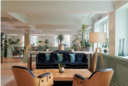
Hotel Melia White House 4* Albany St, London NW1 3UP Londres

14.45 h. Llegada a Londres-Gatwick y traslado al hotel en autobús privado