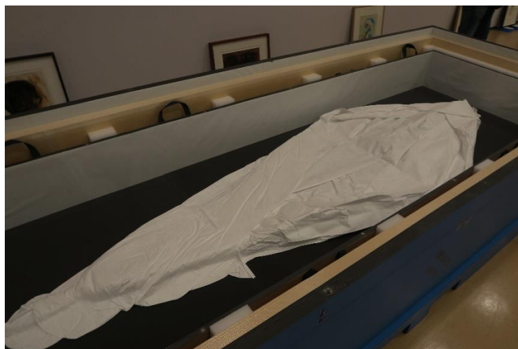
Caja con vaciado de espuma adaptado a la obra de arte.

En el caso de cajas compartidas, se agruparán obras de dimensiones similares, con raíles o separadores entre ellas para evitar que rocen unas con otras.