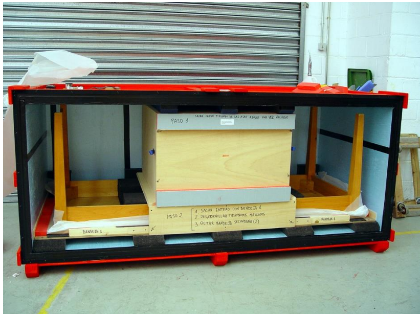
Caja compartida para obras tridimensionales.