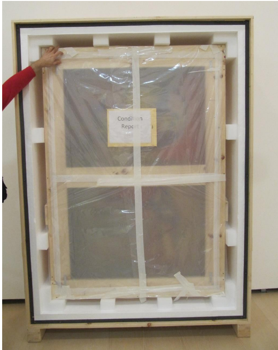
Caja de apertura frontal para una sola obra con marco de viaje.