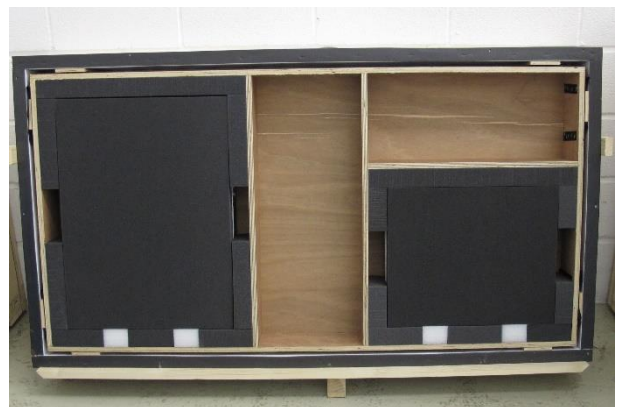
Caja compartida de apertura frontal