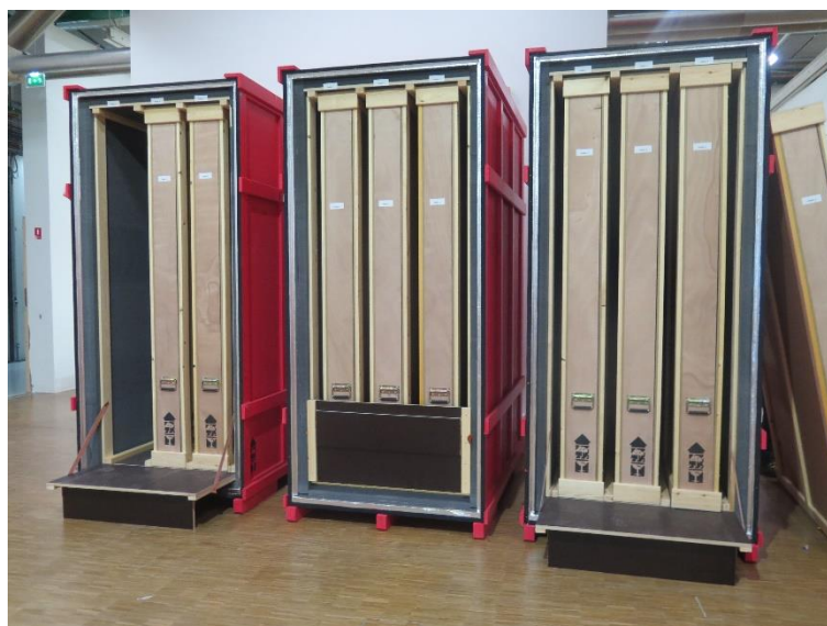
Caja compartida con marcos de viaje y placa de Masonita .

En el caso de cajas compartidas, se agruparán obras de dimensiones similares, con raíles o separadores entre ellas para evitar que rocen unas con otras.