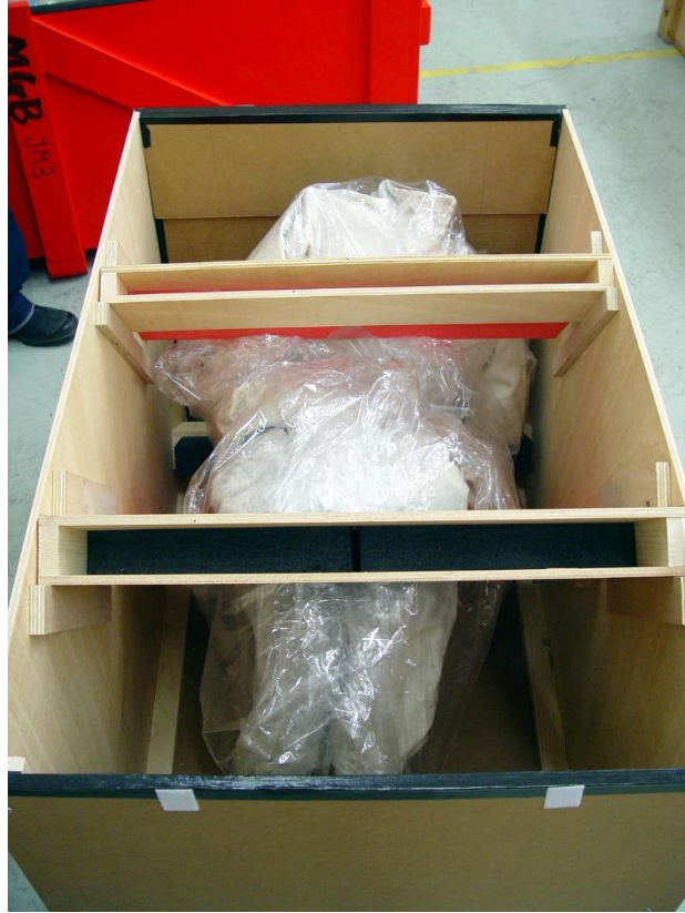
Abrazaderas interiores adaptadas a la forma de la obra de arte.